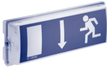
RZ 6011.1 CG-S