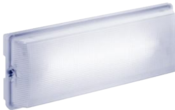
SL 6011.1 CG-S